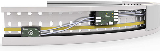
Resim 2 : AS-i Motor modül kablo kanalı, IP54, SEW frekans dönüştürücü için M12, 2I (BW3406)

Motor rölelerin motor modüllerine ek olarak, Bihl+Wiedemann sürücü çözümler alanında ayrıca AC motorların dolaylı kontrolünü sağlar. Kablo kanalı için optimize edilmiş AS-i modülleri burada da yüksek esneklik ve serbest tesis tasarımı nı sunar. Böylece örneğin: SEW MOVIMOT veya Lenze Smart motorlar etkili ve ekonomik bir şekilde kontrol edebilirsiniz.